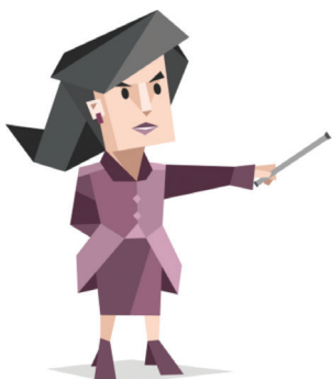
Le Commandant (ENTJ)