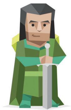
Le Protagoniste (ENFJ)